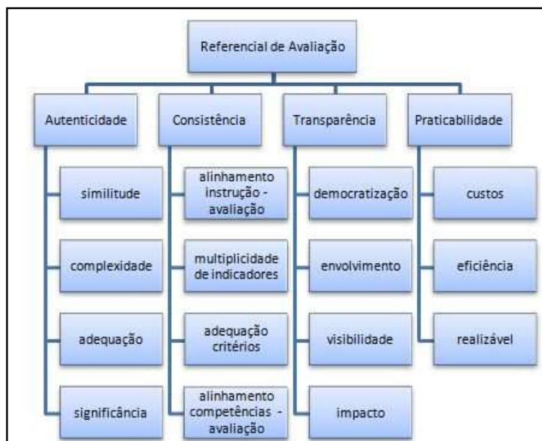
Figura 1 – Dimensões da avaliação alternativa digital – Modelo PrACT

do que apenas ilustrar os diferentes traços de cada dimensão, possibilitam uma descrição operacional do grau de realização de cada critério.