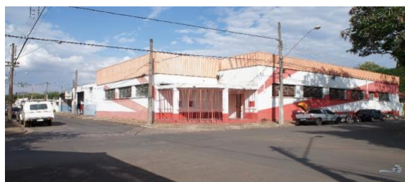
Figura 14 – Associação Beneficente Cultural e Recreativa Tamoyo