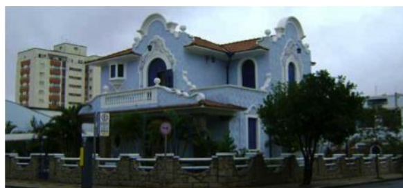
Figura 3 – Residência da família Fontes (primeira metade do século XX)