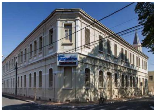
Figura 4 – Colégio Puríssimo Coração de Maria (1909)