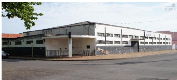
Figura 13 – Associação Beneficente e Recreativa José do Patrocínio