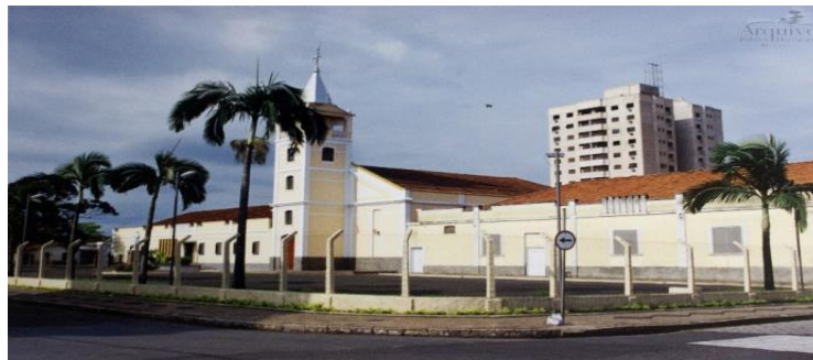
Figura 12 – Igreja da Boa Morte