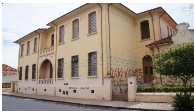
Figura 17 – Escola Estadual Irineu Penteadó