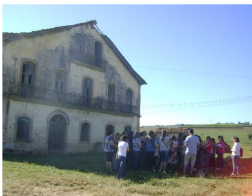
Figura 20 – Antiga casa do barão de Grão-Mogol. Mata Negra, Ajapi