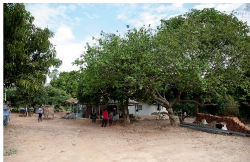
Figura 19 – Chacrinha dos Pretos