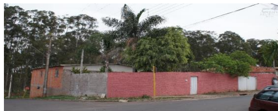
Figura 16 – Terreiro de candomblé Ilê Asê Obaodokiran

Fonte: Arquivo Público e Histórico de Município de Rio Claro. (2014)