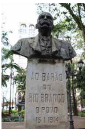
Figura 7 – José Maria da Silva Paranhos Jr. (1914)