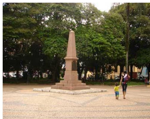
Figura 21 – Praça da Liberdade