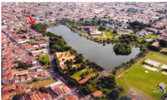
Figura 18 – Parque Lago Azul