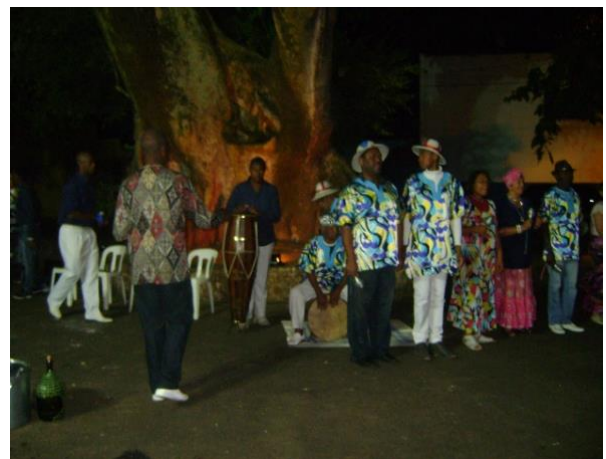
Figura 11 – Umbigada de São Benedito na Praça da igreja de São Benedito