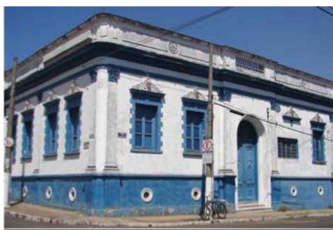
Figura 2 – Residência do barão de Porto Feliz