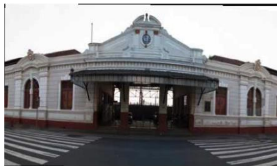
Figura 5 – Estação ferroviária (1911)