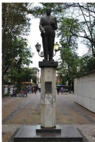
Figura 6 – Arthur Bilac (1909)