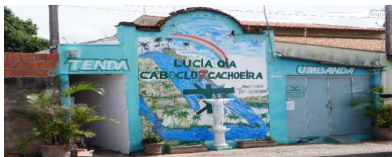
Figura 15 – Tenda de Umbanda Lúcia OIá Caboclo 7 Cachoeiras