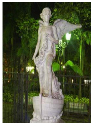
Figura 8 – Anjo da Concórdia (1927)