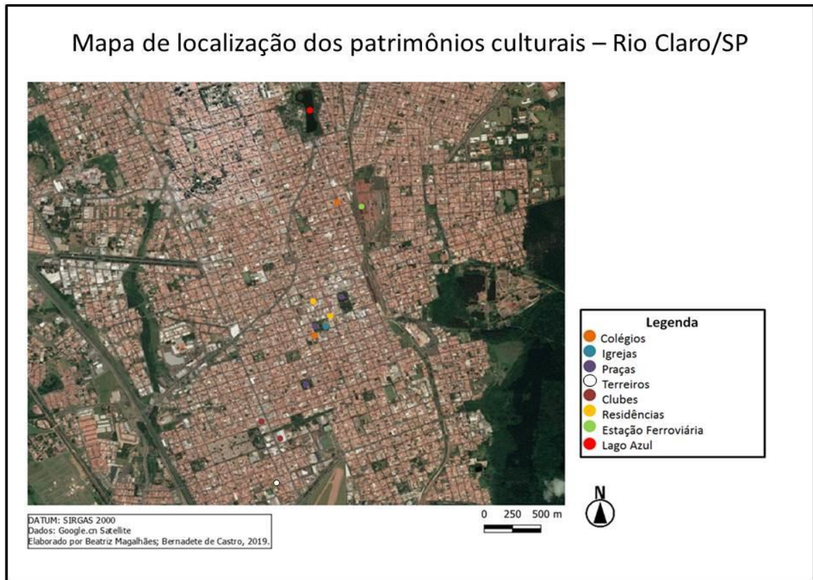
Figura 9 – Localização dos patrimônios culturais em Rio Claro/SP