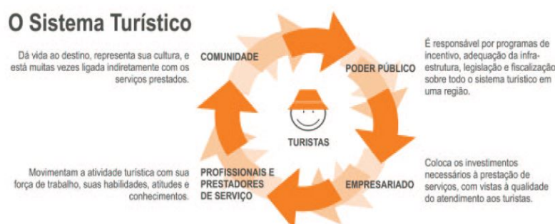
Figura 02: O Sistema Turístico