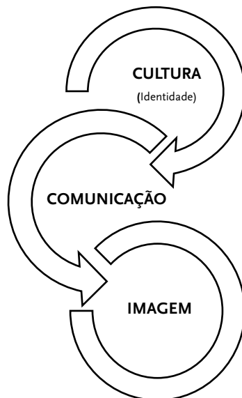
Figura 4: Traços da expressividade organizacional: comunicação, cultura e imagem

Como Hatch e Schultz (1997), acreditamos que os fenômenos da identidade, da cultura, da imagem e da comunicação (acrescentamos nós) apresentam uma estreita relação na vida organizacional, na medida em que constituem pilares de um sistema de significação. Por isso, o estudo da comunicação exige uma atenção particular ao processo simbólico global que atravessa a organização e cruza as suas fronteiras internas e externas. Ou seja, implica uma descoberta da organização expressiva de Schultz et al. (2000), como passaremos a explicar.