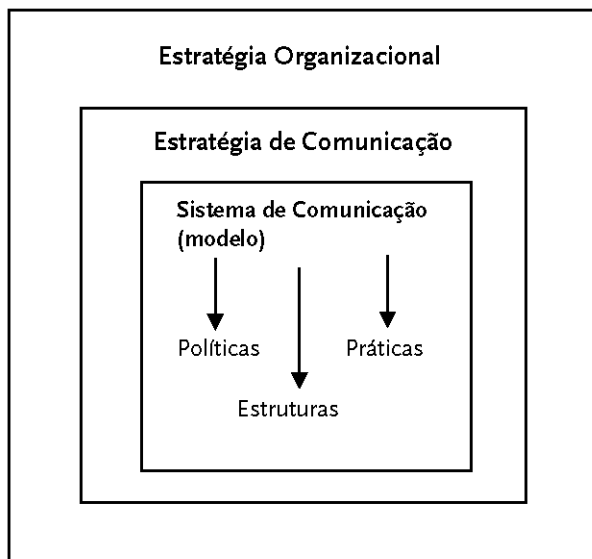
Figura 3: A comunicação aplicada nas organizações

Com esta última análise dos modelos de comunicação em contexto organizacional, concluímos a apresentação dos conceitos centrais à comunicação organizacional aplicada (ver Figura 3). Tratou-se de um enquadramento produzido com base numa permanente interdisciplinaridade a partir dos ensinamentos da Comunicação de Marketing, da Comunicação de Gestão, da Comunicação de Negócio, da Comunicação Estratégica e das Relações