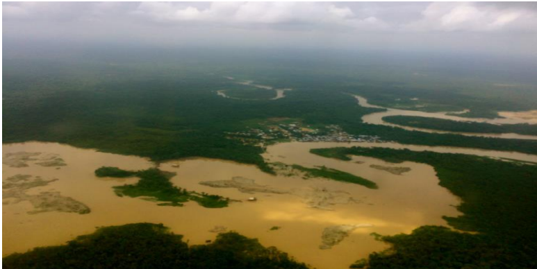
IMAGEM 1- Efeitos da exploração ilegal da mineração no Rio Atrato em 2016