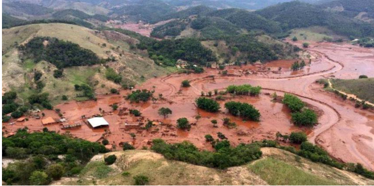
IMAGEM 2- Rio Doce após o Rompimento da barragem