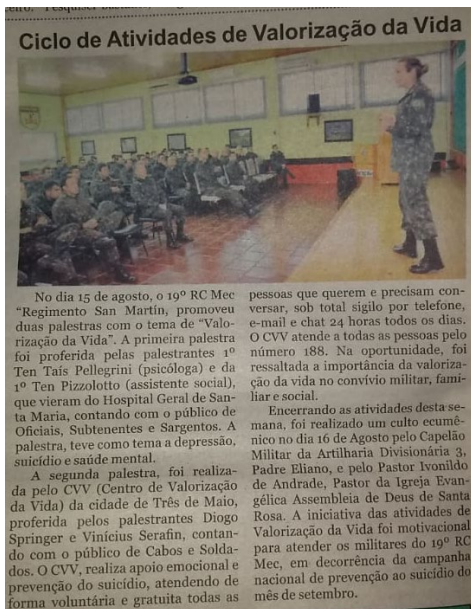
Figura 4. Notícia veiculada pelo jornal Gazeta Regional em 21 de agosto, página 4.

Por fim, em 31 de agosto o jornal Gazeta Regional abordou a campanha do Setembro Amarelo (Figura 5).