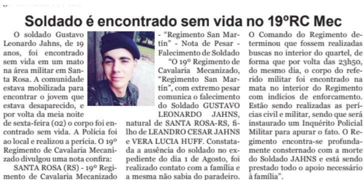
Figura 2. Notícia veiculada pelo jornal Gazeta em 07 de agosto, contracapa.

No jornal Gazeta de 07 de agosto, uma notícia específica de suicídio foi encontrada na contracapa (Figura 2). Informações pessoais do jovem que cometeu suicídio são encontradas no texto, como nome completo, idade e nome dos pais. Em sensibilidade à família, a ABP recomenda que não sejam citados dados pessoais do suicida em notícias. Além disso, o método de enforcamento é citado, sendo que esse aspecto deveria ser omitido para evitar inspirar outros jovens em situação similar, de acordo com os manuais da OMS e ABP.