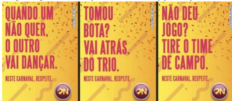
Figura 2: Imagem do outdoor da campanha de Carnaval da Skol 2015 após o seu reposicionamento