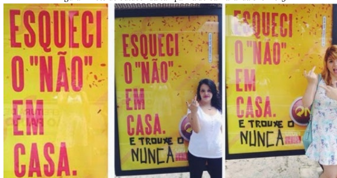
Figura 1- Foto do outdoor da campanha de Carnaval da Skol 2015