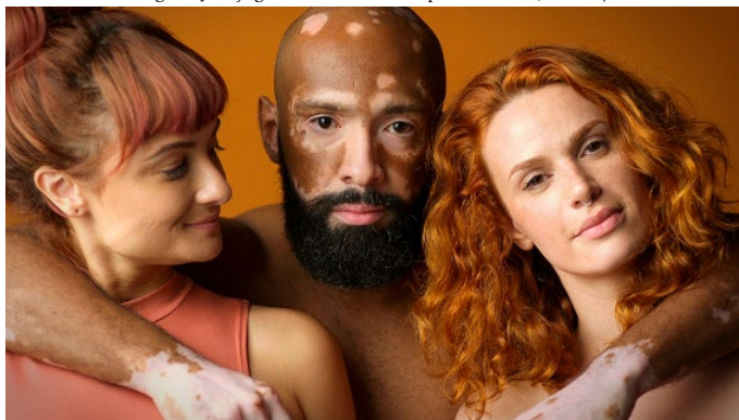
Figura 4: Peça gráfica da Skol na campanha Skolors, de 2017