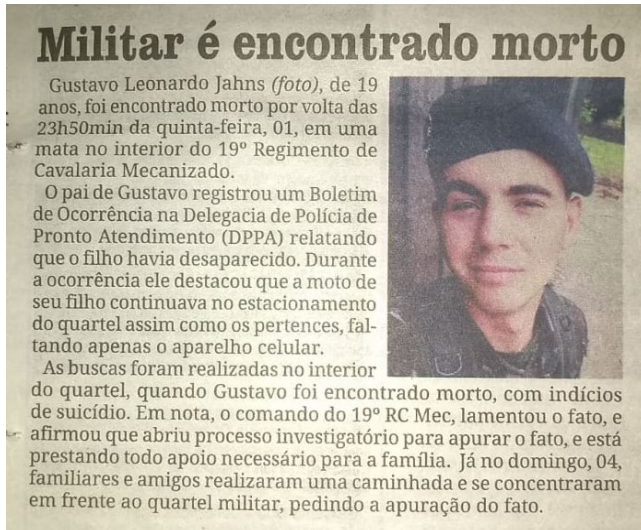
Figura 3. Notícia veiculada pelo jornal Noroeste em 09 de agosto, contracapa.

Também não há telefones ou endereços para obtenção de ajuda. Um aspecto que deve ser evitado em matérias dessa natureza é a publicação de fotos ou quaisquer imagens relacionadas à situação, no entanto, a recomendação não foi observada e a foto do jovem foi utilizada para ilustrar a matéria em ambas as contracapas.