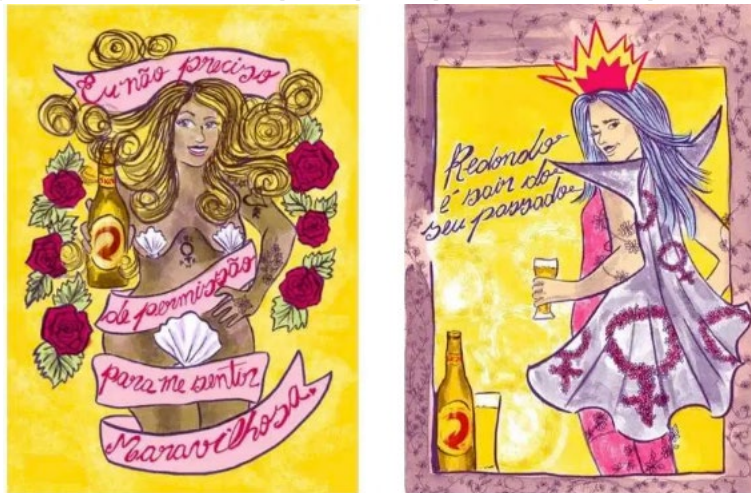
Figura 5: Ilustração de Camila do Rosário produzida para a campanha “Redondo é sair do seu passado”, de 2018.

Fonte: https://exame.abril.com.br/estilo-de-vida/redondo-e-sair-do-seu-passado-a-nova-campanha-da-skol/