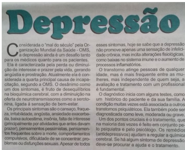
Figura 1. Notícia veiculada pelo jornal Noroeste em 02 de agosto, página 5.

No jornal Noroeste de 02 de agosto, foi publicada uma matéria sobre depressão, uma doença mental citada pela OMS e ABP como fator de risco para suicídios. Informações sobre sintomas, diagnóstico e tratamento encontram-se no texto (Figura 1).