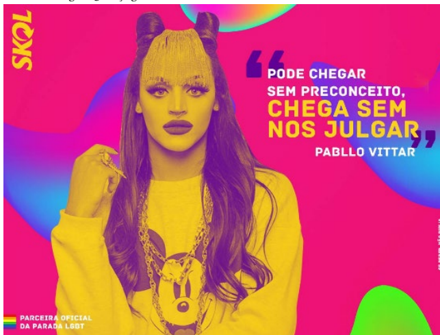
Figura 3: Peça gráfica da Skol como Parceira Oficial da Parada LGBT

Assim, de 2016 em diante, estabeleceram-se relações mais genuínas com o seu público, ressaltando também a empatia e o respeito com as minorias. Em maio de 2016, pela primeira vez a Skol foi a parceira oficial da 19ª Parada do Orgulho LGBT em Belo Horizonte, enfatizando o seu respeito à diversidade conforme a figura 3 a seguir.