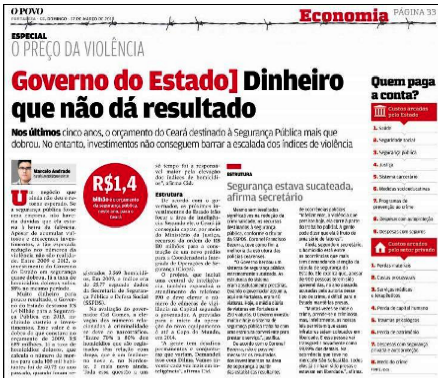
Figura 2 – Página de O Povo com a reportagem “Dinheiro que não dá resultado”

Um negócio que ainda não deu o retorno esperado. Se a segurança pública fosse uma empresa, não haveria dúvidas que ela estaria à beira da falência. Apesar de acumular vultosos e crescentes investimentos, a tão esperada redução nos números da violência não são realidade (Jornal O Povo , 17 mar. 2013).