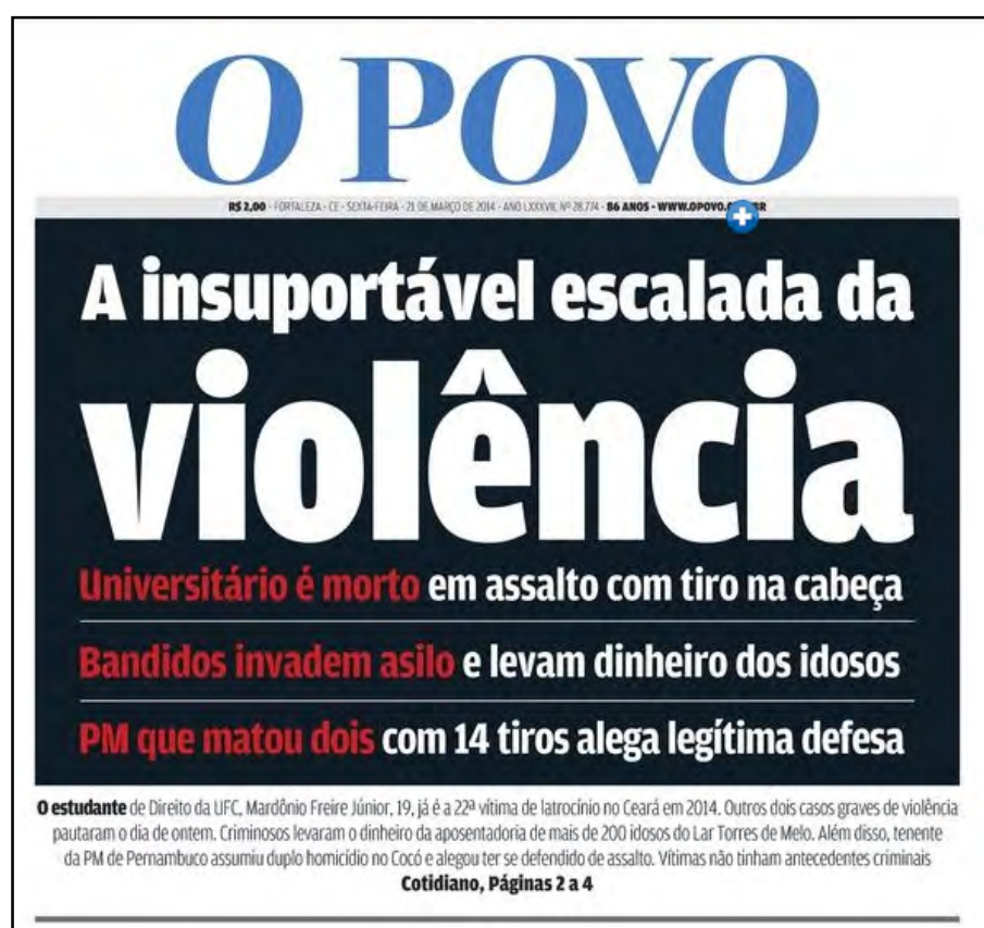
Figura 1 – Capa do jornal O Povo em 21 de março de 2014